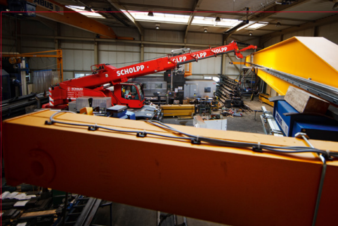
Hallenkranmontage - Maßarbeit bei engsten Platzverhältnissen