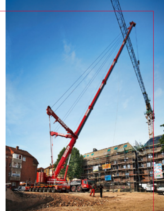
Baukranmontage mit Hilfe des S-GK 400

nug, wenn sich ein Auftrag einmal ad hoc verändert.